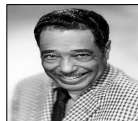
“UN PROBLEMA ES TU OPORTUNIDAD PARA QUE HAGAS TU MEJOR ESFUERZO” (Duke Ellington)