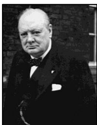
“LAS DIFICULTADES DOMINADAS, SON OPORTUNIDADES GANADAS” (Winston Churchill)